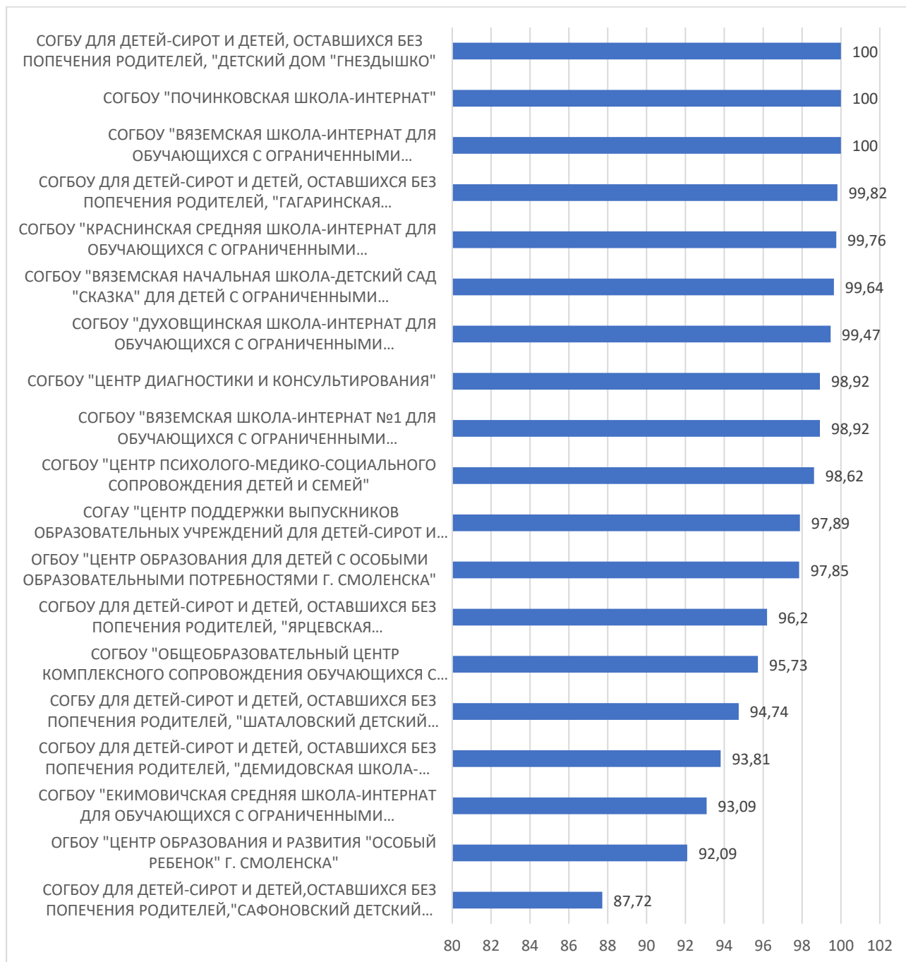
Рисунок 5 – Рейтинг организаций по критерию «Удовлетворенность условиями осуществления образовательной деятельности организаций»