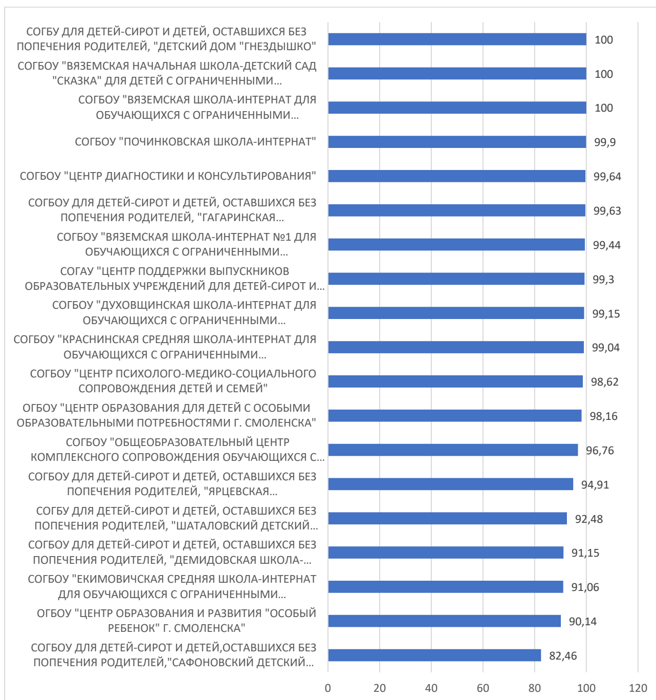
Рисунок 4 – Рейтинг организаций по критерию «Доброжелательность, вежливость работников организации»