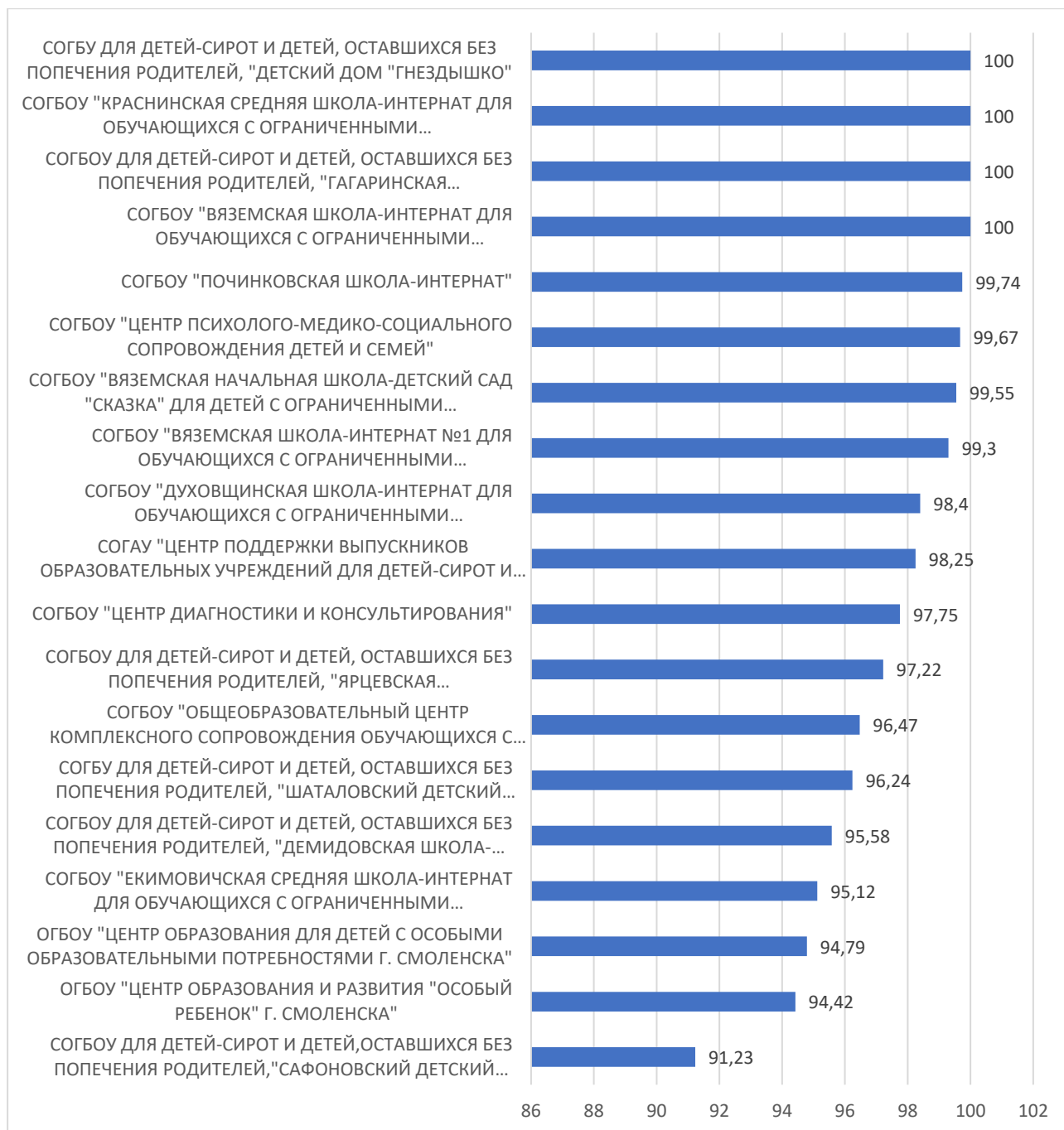
Рисунок 2 – Рейтинг организаций по критерию «Комфортность условий, в которых осуществляется образовательная деятельность»