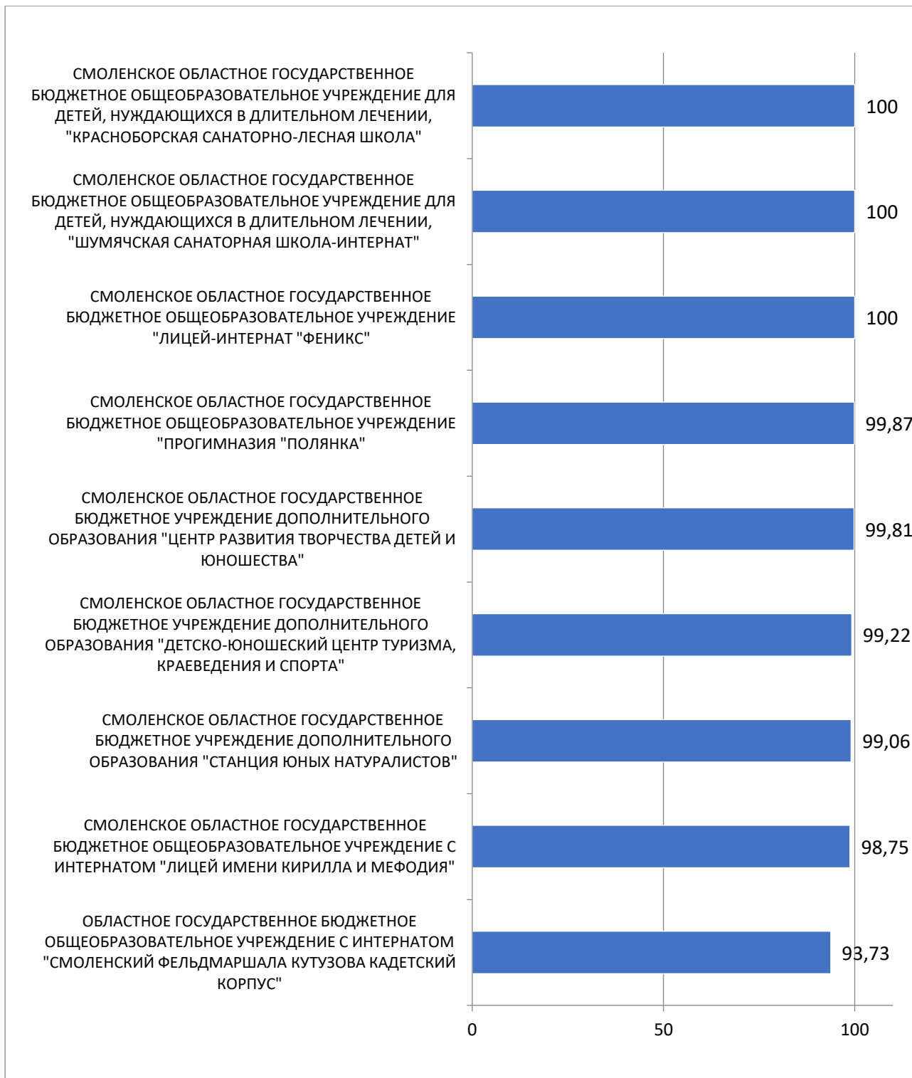
Рисунок 5 – Рейтинг организаций по критерию «Удовлетворенность условиями осуществления образовательной деятельности организаций»