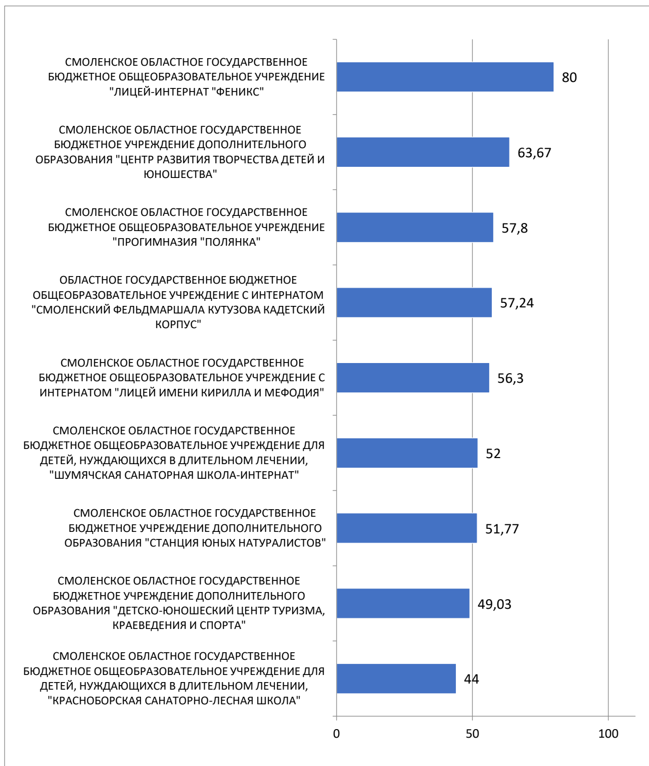
Рисунок 3 – Рейтинг организаций по критерию «Доступность образовательной деятельности для инвалидов»