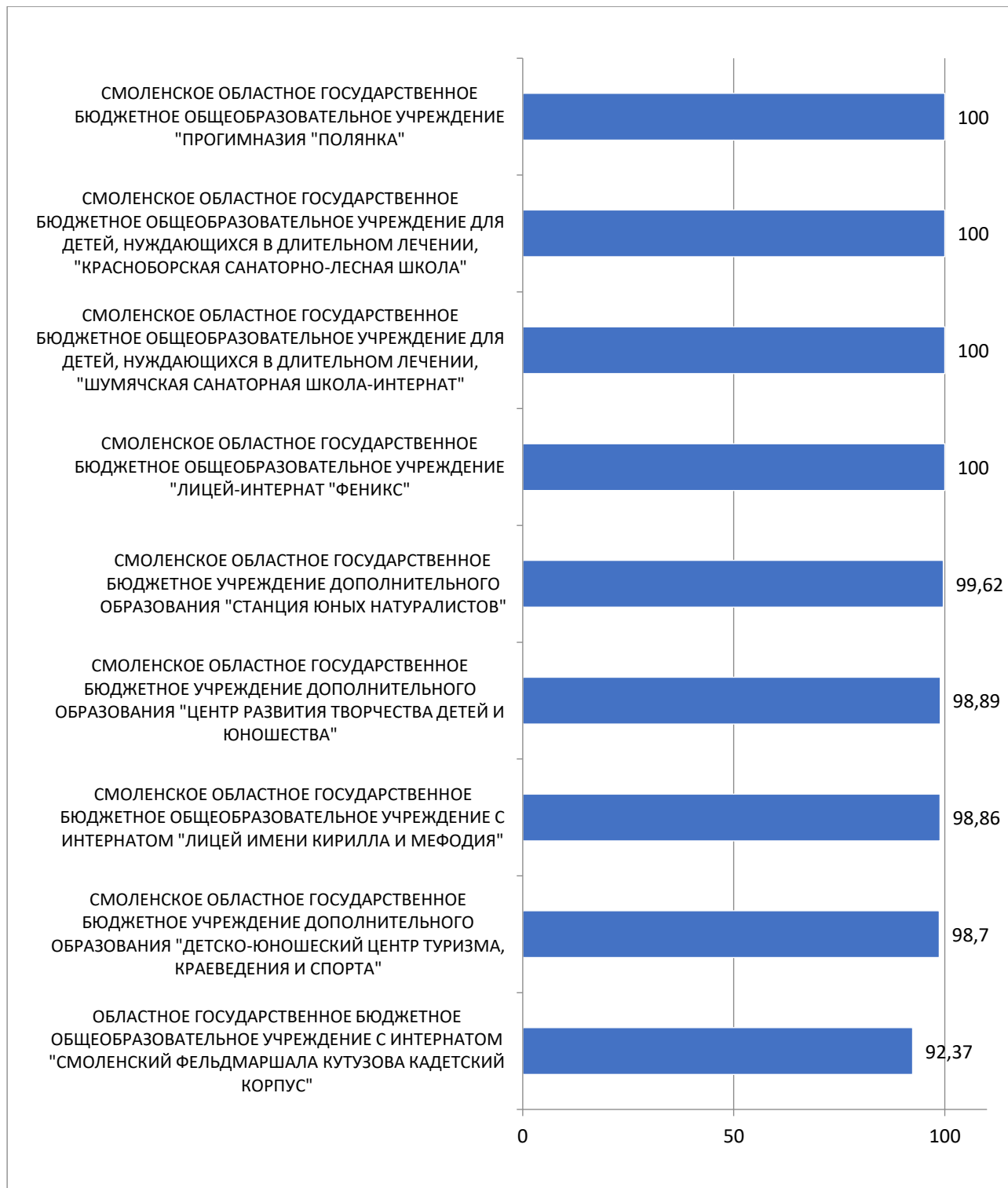
Рисунок 2 – Рейтинг организаций по критерию «Комфортность условий, в которых осуществляется образовательная деятельность»