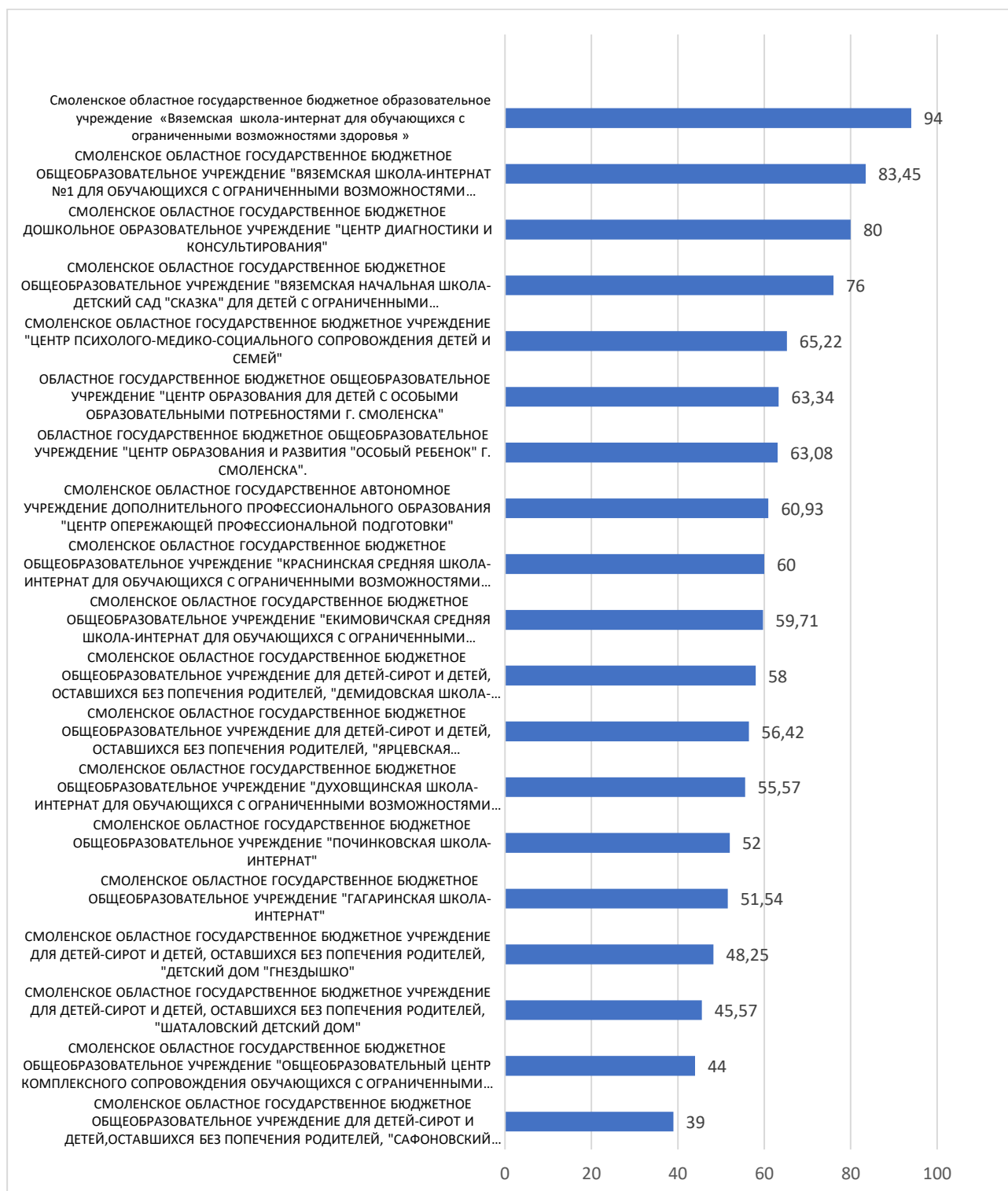
Рисунок 3 – Рейтинг организаций по критерию «Доступность образовательной деятельности для инвалидов»