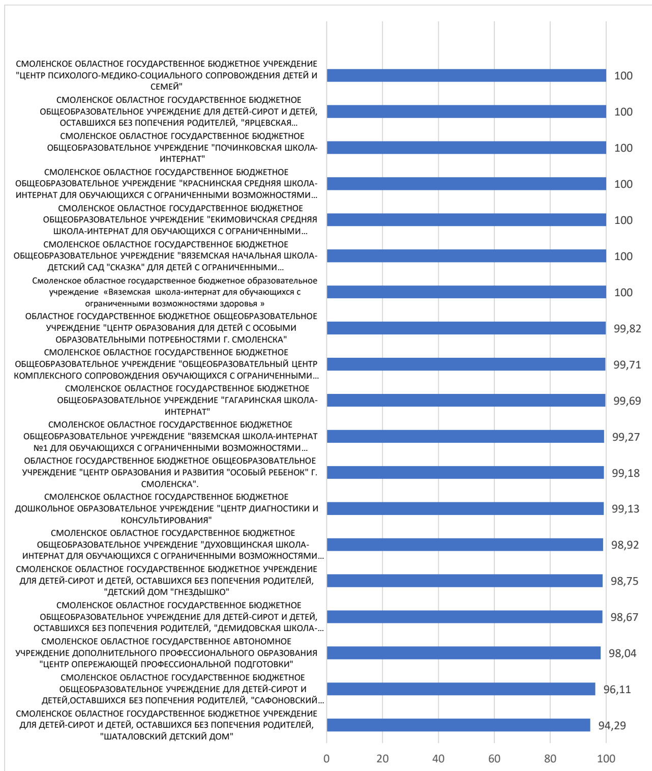
Рисунок 4 – Рейтинг организаций по критерию «Доброжелательность, вежливость работников организации»