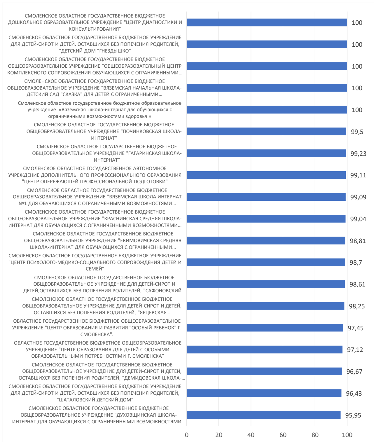
Рисунок 2 – Рейтинг организаций по критерию «Комфортность условий, в которых осуществляется образовательная деятельность»